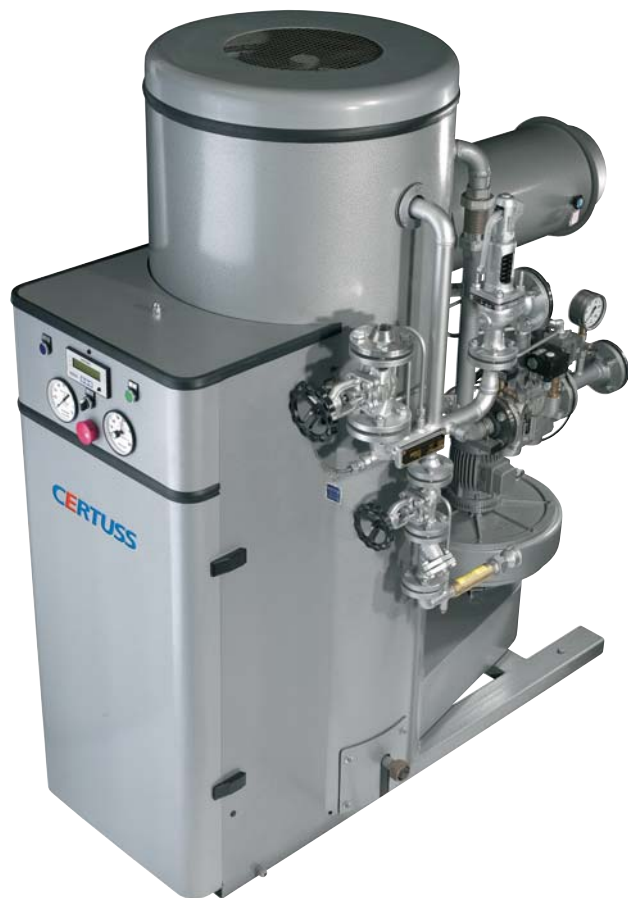
Junior SC výkon páry 80 - 600 kg/hod